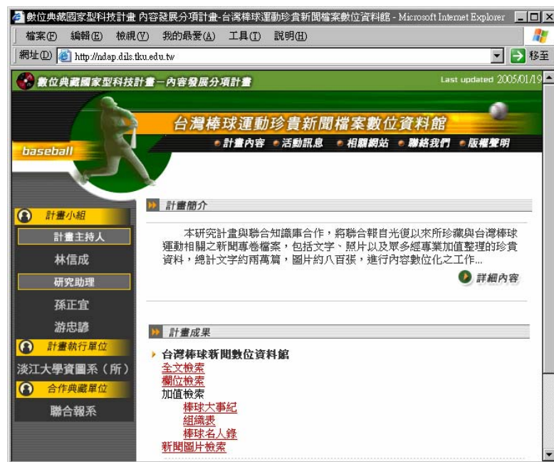
圖 2 台灣棒球運動珍貴新聞檔案數位資料館首頁 ( http://ndap.dils.tku.edu.tw )

為了儘快建立一個可供大眾使用之主題式「台灣棒球運動珍貴新聞檔案數位資料館」，我們在類目表規劃的同時亦同步進行典藏系統的分析與設計、資料庫的建置，並開發親和之使用介面與便捷之檢索系統。從使用者層面而言，目前已完成的第一期系統，約有資料 2 萬多筆，檢索功能則有傳統的「全文/欄位檢索功能」和針對專卷特性設計的「加值檢索功能」；而加值檢索則又分為「專卷類目表」、「棒球大事記」和「棒球名人錄」等。系統首頁如下圖所示。