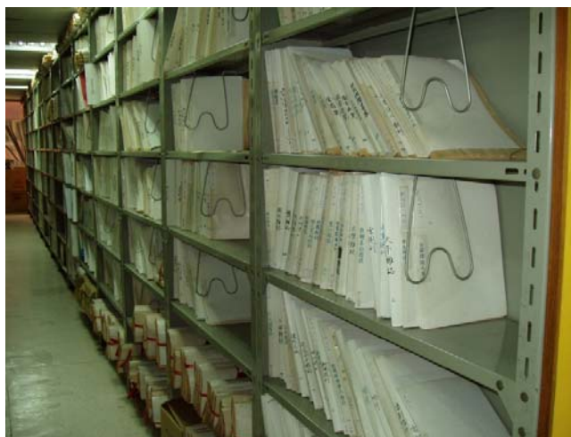
圖 1 聯合報新聞專卷

所謂「新聞專卷」是針對不同的新聞主題，把相關的資料加以收集、組織、整理，再分門別類建檔的歷史性新聞文獻。最初只是報社為了提供採編同仁在新聞事件發生時，能有快速、完整且可靠的資料來源可供參考，於是由資料整理人員每日剪報、分類、建檔，供編輯、記者使用，不必再另花時間搜尋或查證。未料長期下來，竟建立了一個又一個完整且可信度高的資料檔，累積成一座資料豐富的專門圖書館（如圖 1 所示），記錄了整個社會發展的軌跡。