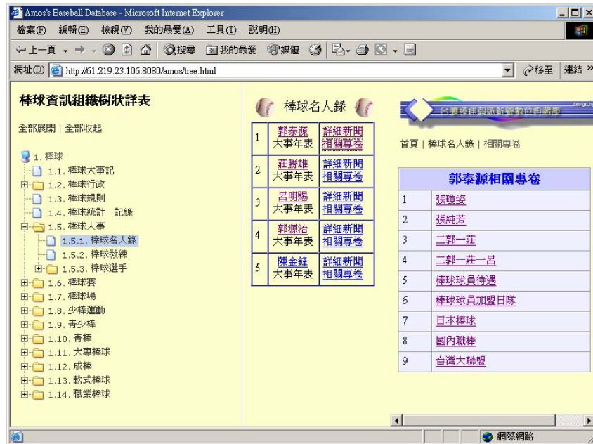
圖 4 郭泰源的相關專卷