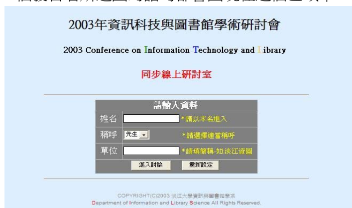
圖 2 同步研討室的入口 18

圖 3 則是進入同步研討室後的畫面。在畫面的右上角會標示著目前線上總人數，及其姓名、稱謂、所屬單位。在畫面的下方有一個可以輸入的文字列，當與會者想要發言時可在此鍵入想要發言的內容。中間大部分的空間則用來顯示大家的發言，每一個發言者所送出的語句都會出現在這個區域中。