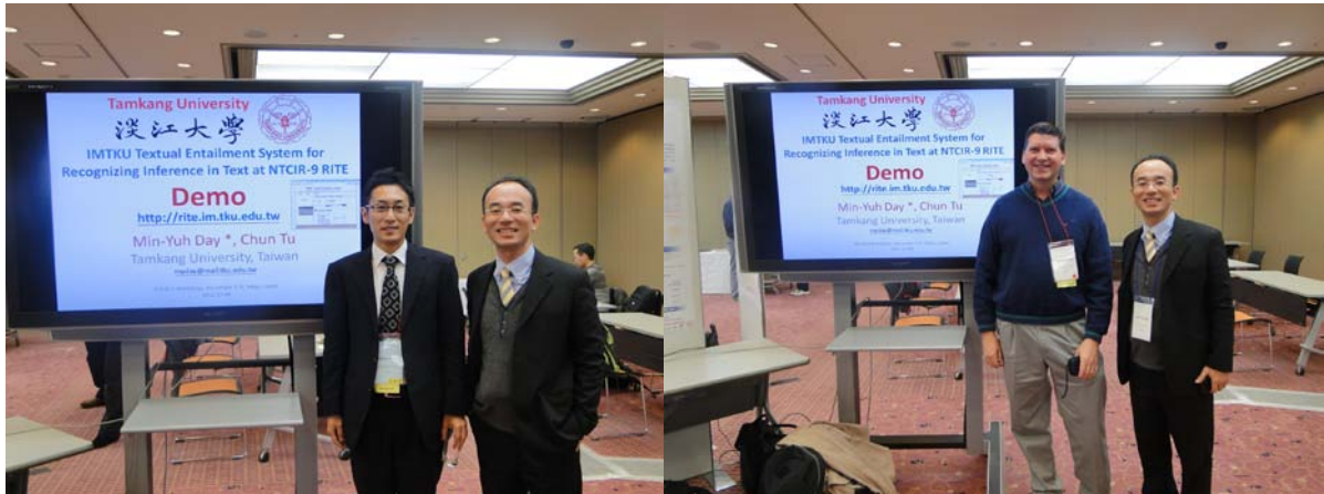
淡江資管系於日本 NTCIR 國際資訊競賽發表 IMTKU RITE system 活動照片, 2011.12.08.