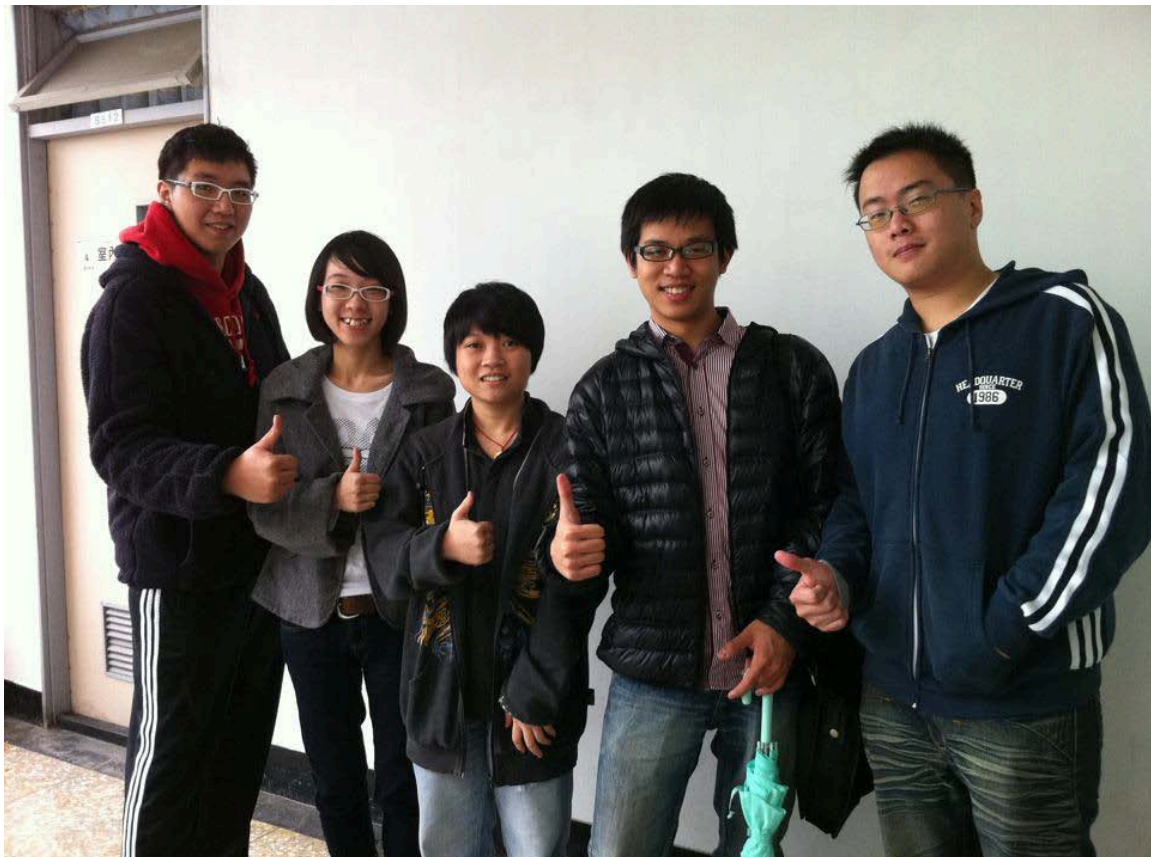
NTCIR-9 RITE Demo System 開發團隊：IMTKU 淡江資管系學生團隊