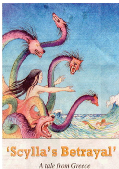
圖 7. Scylla