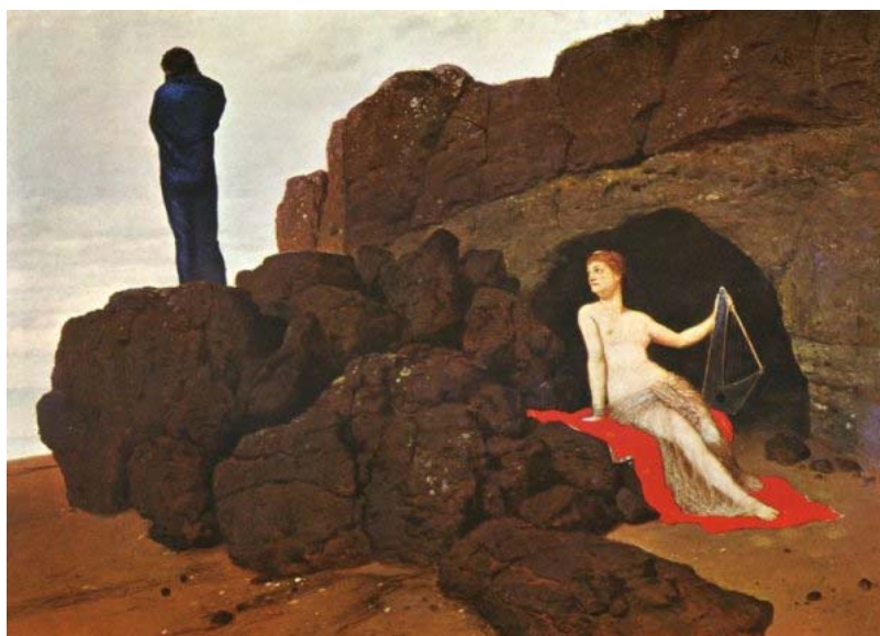
圖 9. Arnold Böcklin, Odysseus and Calypso 1883

只有剩下 Odysseus 的船，被漂流到 Calypso 的小島，那這邊也沒有發生什麼事情，就在這邊待了七年。