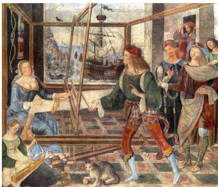
圖 10. Pinturicchio , The Return Of Odysseus

書上是說，他碰到了一個人，這個是雅典娜，智慧女神也是他的守護神，他不認識她，雅典娜也化妝，然後雅典娜知道說 Odysseus 是爲了保護自己隱藏自己的身分，但是一下子就被雅典娜看穿了！雅典娜贊同他這樣的作法，但是跟他講說：「你的兒子等一下會跟你碰面。」於是他就跟他的兒子兩個人要回到他的家。那這時候他的家，就是他的太太原先要阻擋求婚者的計謀已經被識破了！被他的女僕洩密，於是她必須從她的求婚者選一個人，現在是一個關鍵時刻(圖 10)。