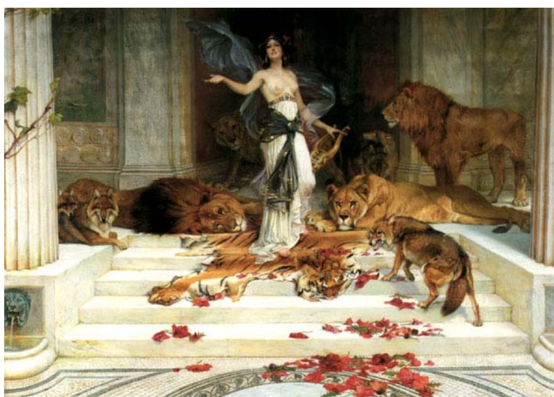
圖 5. Wright Barker, Circe , 1890

下一站又來到一個小島，這個小島也是一個巨人族，但是，是食人族(Laistrygones, the cannibal people)，是吃人的。本來還有 12 艘船，被食人族破壞了只剩一艘，是 Odysseus 比較大的那一艘。