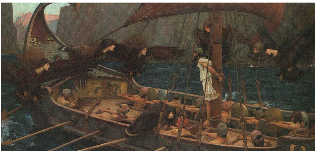
圖 6. Waterhouse, Ulysses and Sirens ,1900

最後他們就離開這個地方得到重要的訊息，他們又回到 Circe 這邊，Circe 最後跟他講，接下來你會遇到妖島 Siren，她會唱很迷人的聲音，那你千萬不要聽，聽了之後你就回不了家，因為她是在海島上面，有很多暗礁，聽了之後你忘記要划船，妳就會觸礁。那 Odysseus 的方法就是讓所有的船員的耳朵都塞起來，用蠟塞起來；把他自己綁在船尾上面，他沒有塞，他要聽聽看 Siren 唱的歌是什麼(圖 6)。