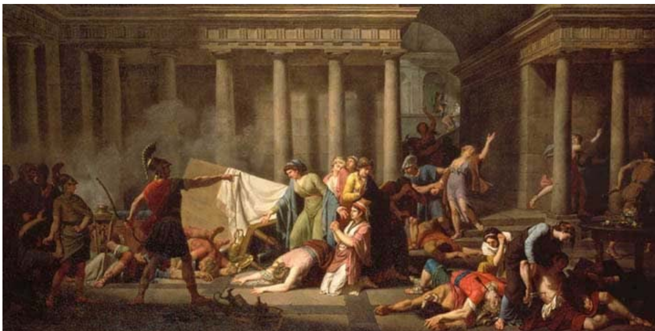
圖 12. Nicolas Monsiau, early 1800s

最後 Odysseus 和他的老婆見面了。起初他太太只是聽兒子說，爸爸回來了，但她不相信那個老人是她的丈夫，就慢慢測試、刁難他。而 Odysseus 爲了證明他自己，就說他家的床是當初他們結婚時，自己親手做的，他家門前有一棵樹，他們把樹種在床上，沿著樹把床做出來的。而這件事只有他們兩個知道，所以證明了他是她先生，於是就相認了。相認之後還有故事，因他殺了 108 人，這些人的家庭也會來報復，最後是由雅典娜出面叫他們不要繼續打下去，故事才結束。