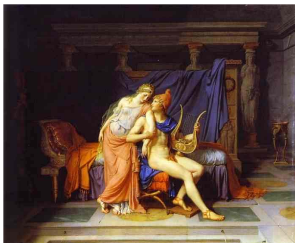
圖 5. Jacques-Louis David. The Love of Paris and Helen . 1788

這個故事要追溯到海倫是怎麼來的。海倫和 Zeus 也有關係。Zeus 跟斯巴達的王后 Leda 發生了一段戀情，Zeus 爲了接近 Leda，他把自己變成天鵝。Leda 就和他相好，之後就生下了天鵝蛋，這顆蛋孵化出來是雙胞胎，一男一女，女的是 Helen，男的是 Polydeuces。那 Leda 跟他原來的國王也生下了雙胞胎，也是一男一女，女的是 Clytemnestra。Helen 後來變成斯巴達的王后，Helen 同母異父的姊姊(Clytemnestra)是 Agamemnon 的太太，那 Agamemnon 和 Menelaus 是兄弟，Menelaus 是斯巴達的國王，Agamemnon 是麥錫尼的國王。總之 Agamemnon 娶了 Clytemnestra，Menelaus 娶了 Helen。這兩個女生都和特洛伊戰爭有關係，特洛伊的原因是海倫，海倫在年輕的時候，就被希臘各個城邦的王子看上。但她只能嫁給一個國王，最後海倫還是選擇了 Menelaus。嫁給了斯巴達的國王，變成了斯巴達王后。於是其他的王子和國王就達成了協議，海倫是公眾財產，欺負她就等於欺負那些王子和國王。