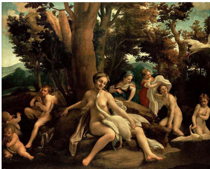
圖 4. Correggio, Leda and the Swan

這個故事要追溯到海倫是怎麼來的。海倫和 Zeus 也有關係。Zeus 跟斯巴達的王后 Leda 發生了一段戀情，Zeus 爲了接近 Leda，他把自己變成天鵝。Leda 就和他相好，之後就生下了天鵝蛋，這顆蛋孵化出來是雙胞胎，一男一女，女的是 Helen，男的是 Polydeuces。那 Leda 跟他原來的國王也生下了雙胞胎，也是一男一女，女的是 Clytemnestra。Helen 後來變成斯巴達的王后，Helen 同母異父的姊姊(Clytemnestra)是 Agamemnon 的太太，那 Agamemnon 和 Menelaus 是兄弟，Menelaus 是斯巴達的國王，Agamemnon 是麥錫尼的國王。總之 Agamemnon 娶了 Clytemnestra，Menelaus 娶了 Helen。這兩個女生都和特洛伊戰爭有關係，特洛伊的原因是海倫，海倫在年輕的時候，就被希臘各個城邦的王子看上。但她只能嫁給一個國王，最後海倫還是選擇了 Menelaus。嫁給了斯巴達的國王，變成了斯巴達王后。於是其他的王子和國王就達成了協議，海倫是公眾財產，欺負她就等於欺負那些王子和國王。