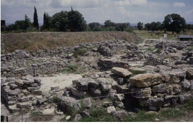
圖 2. 特洛伊古城遺跡: Troy VI house remains, from NW