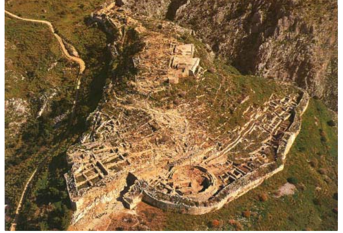
圖 2. 麥錫尼城古城遺跡

接下來講這部史詩的歷史背景蠻簡單的，因為我們只知道有這個戰爭，而戰爭的經過只有史詩的紀錄，沒有歷史的紀錄，歷史只有紀錄戰場在什麼地方，這個戰場是十九世紀的考古學家發現的，這部史詩牽涉的戰爭就是希臘跟特洛伊(就是現在的土耳其)(圖 1)。特洛伊是直布羅陀海峽旁的一個重要城市，是一個通商很重要的位置。故事的主角 Odysseus，是住在希臘北邊的一個小島 Ithaca 的國王。希臘還有很多的城市，是由希臘城邦的首領所組成的軍隊坐船遠征特洛伊，戰場主要是在特洛伊的領土上面，而不是在海上。這個歷史原先在十九世紀以前，只是被當成一個古老的故事，可能是想像的，大家認為史詩跟神話差不多，但也有人認為史詩是真的，所以就去調查，然後挖出來戰場的古蹟。他們是先挖出特洛伊的古蹟，然後才去挖邁錫尼的古蹟，最後證明的確是有那樣的戰爭，那也因為特洛伊城(圖 2)和邁錫尼城(圖 3)的古蹟被挖出來，慢慢考古學家才有辦法去推論邁錫尼文化的存在以及前一個文化。