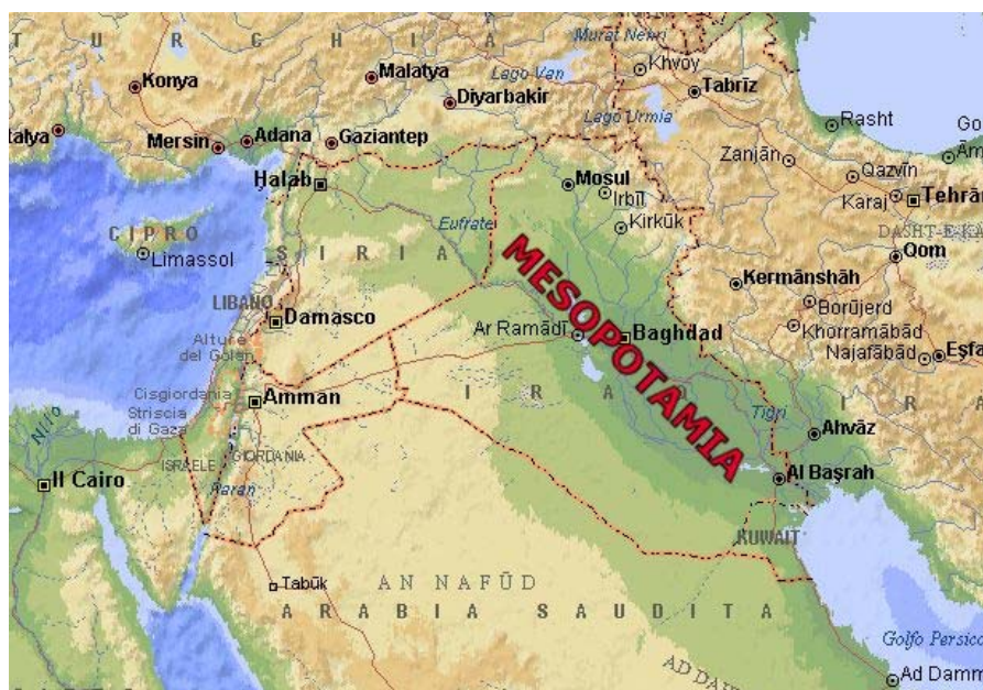
圖 1. 「美索不達米亞」

史詩《基爾嘉美緒》( The Epic of Gilgamesh )大概是到目前為止西洋文學史紀錄的最早的史詩。大家都知道希臘有史詩，但這部史詩比希臘史詩更早，大概在西元前三千年就