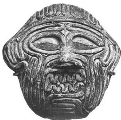
圖 13 The face of Humbaba,

第三、「人與自然衝突」。Gilgamesh 有很多的活動可以跟 Enkidu 一起做。他們一起去「造福人民」做有意義的事情——他們想說森林裡面有很多的資源，特別是樹木，要建造城牆，要建造傢具，就需要森林裡面的樹木，但森林裡面很危險，所以他們兩個要率領軍隊去征服自然，所以他們接下來的從事的活動是征服自然。進入到第三種衝突，就是人跟自然的衝突。不是那麼順利的，因爲森林裡有一個守護神叫做 Humbaba，聽說是一個長得非常恐怖的怪獸，但是他是大地之神 Enlil 派來守護森林的守護神(圖 13)。