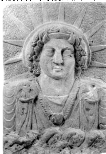
圖 14. Shamash-the sun god