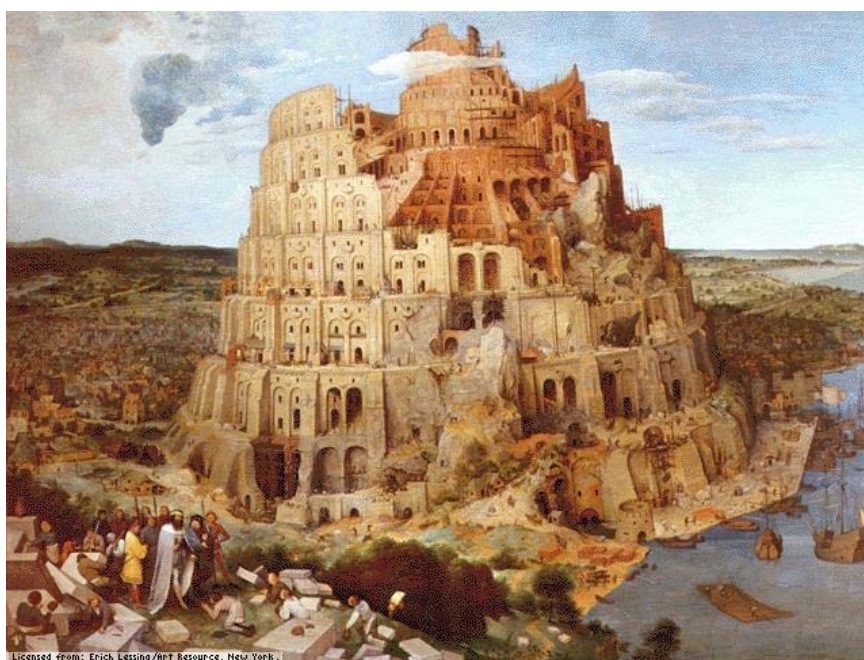
圖 5 Peter Bruegel the Elder. Tower of Babel

我們現在所看到的這個 ziggurat，經過環境的變化，有些地方埋沒在泥土下面，有些地方被考古學家挖出來(圖 4)，大部分現在不容易看的很清楚。建築這樣的「通天塔」需要高超建築技巧，建築裡面也有很多精緻的文物及裝飾。但是這樣的建築卻被他的鄰近的希伯來文化給醜化了。兩河流域的文化和希伯來的文化比較起來，兩河流域的文化開發得比較早。它是已經從狩獵、游牧、然後慢慢改變成農耕的生活模式，已經有定居的生活模式；在那個時候，現在以色列這個地方，還是游牧形式的文化。游牧形式的文化對於這些已經定居的農耕文化有一種忌妒跟焦慮。