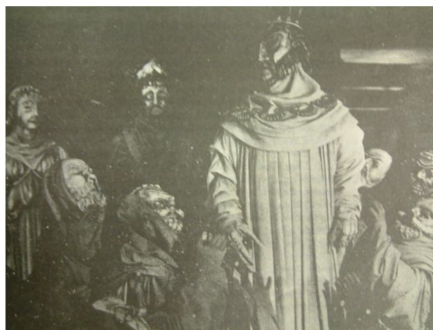
圖 2. Oedipus the King

Sophocles 出生的時間是西元前 496 年，逝世於西元前 406 年。在世的這段期間剛好是雅典的黃金歲月。西元前 480 到 450 年是雅典從一個城邦漸漸要變成是一個帝國的關鍵時刻。蘇福克里斯的作品反映了這個時代的問題。西元前 479 年由雅典所率領的 Delian League 聯盟打敗波斯帝國，從這個時候開始雅典的勢力就越來越龐大。雅典慢慢把聯盟的財力物力挪用到建設雅典的城邦，所以雅典