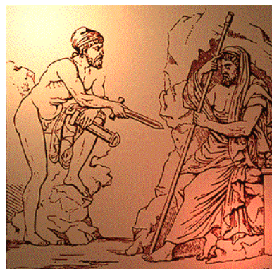
圖 4. Oedipus and Teiresias

第一場戲中主要是有兩個角色之間的語言衝突 2 。一個是Oedipus、另一位是盲眼的預言師Teiresias。