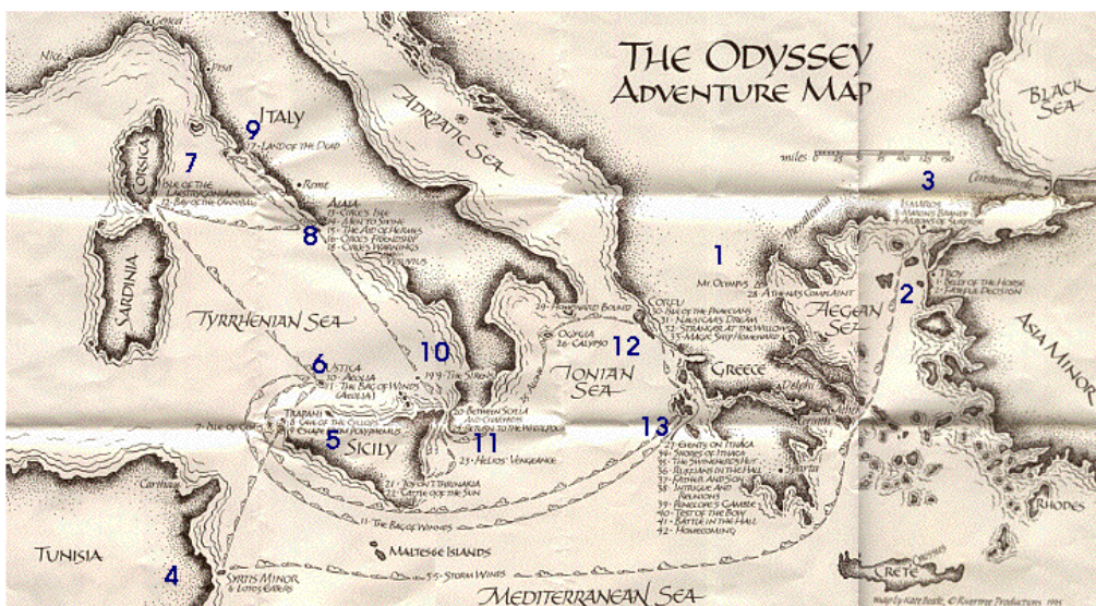
圖 3 特洛伊戰爭中，希臘聯軍和特洛伊纏鬥十年。特洛伊亡國，希臘聯軍也沒什收穫，Achillis 戰死，其他英雄終戰後各自歸鄉。其中以奧德修斯歸鄉之路最為驚險漫長十年。

從特洛伊到 Odysseus 的家鄉 Ithaca，接下來看地圖(圖 3)簡單說明，Odysseus 回家這十年是花在什麼地方。若以現在的帆船行程，如果風平浪靜，兩個禮拜就可以到達，但是他為什麼要花十年??