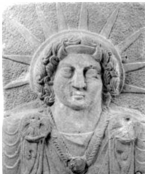
圖 11. Shamash-the sun god