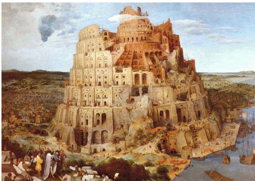
圖 5 Peter Bruegel the Elder. Tower of Babel