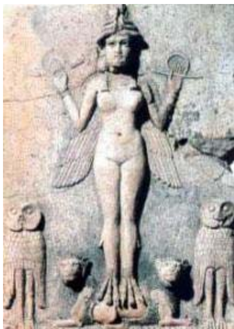
圖 11. Ishtar, Goddess of Love and Destruction

講義第三十一頁有史詩中的人物介紹有幾個重要的神，在讀故事時必須注意。例如:天神 Anu 生下兩個後代，其中一個就是地神 Enlil。(the god of earth, wind and air)，另一位 Ishtar 則是 the god of love and war。而 Ishtar 的角色在希臘神話中有一個與她類似，Venus。與 Venus 常常聯想在一起的是戰神(Mars)。愛與戰爭，在西洋文學中「愛與死」是常關聯在一起的母題。