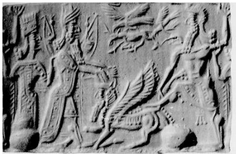
圖 9 Gilgamesh and Enkidu

這是他們兩個「變成人」的故事。一個由半人半神，一個由半獸半人，都是野人的情況下，在彼此認識後，一同遭遇許多不幸的事，而變的比較成熟。這部史詩讓我們去思考人性的特質，以及人性、獸性、神性之間的差別和關聯。