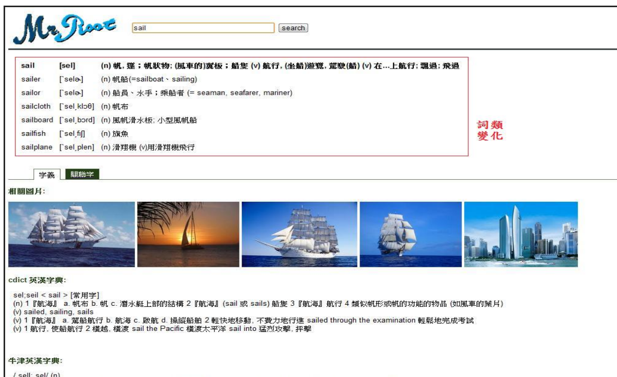
圖 2.1 系統操作介面 -- 詳細字義查詢