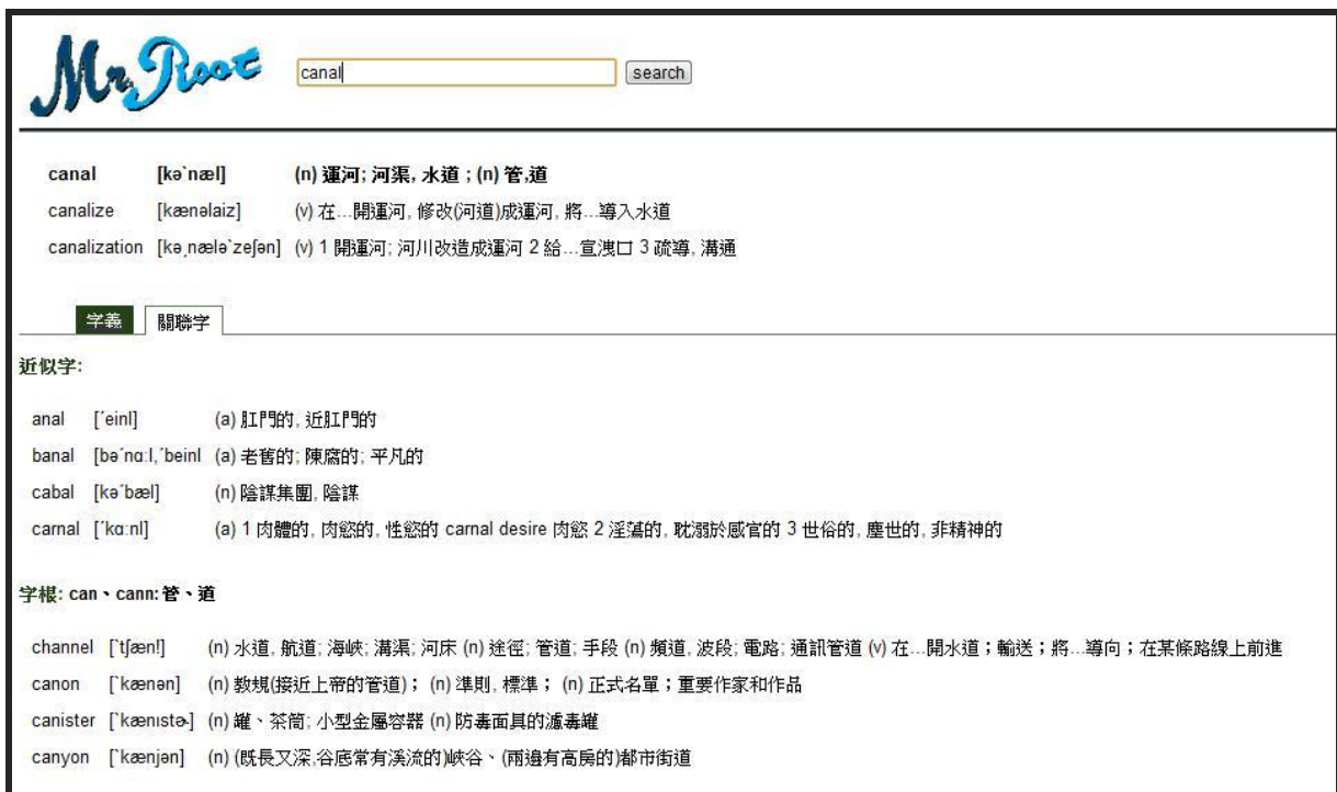
圖 2.2 系統操作介面 - 關聯字查詢

若使用者欲瀏覽該字彙的其他關連字時，僅需點取關聯字子頁面即可，如下圖 2.2 所示。